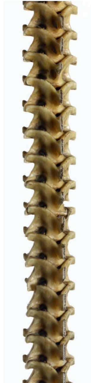
40 bis détail